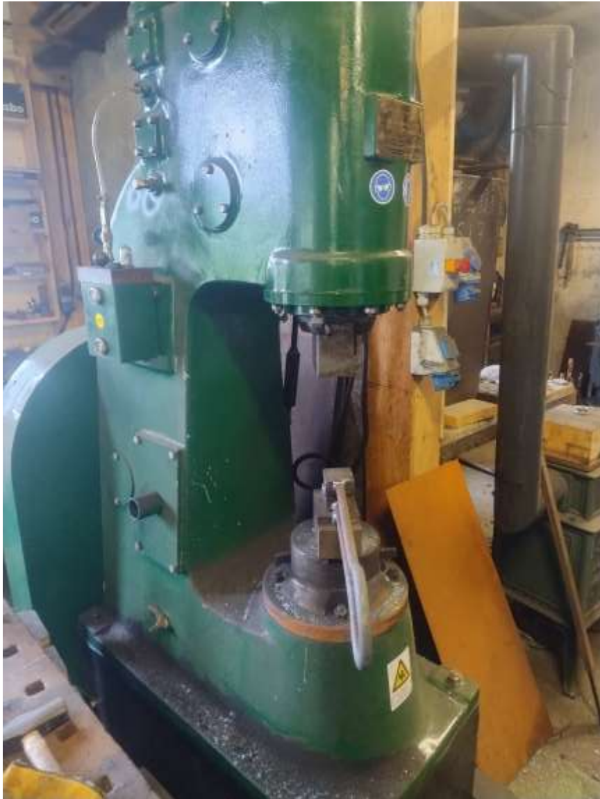
40 kg lufthammer.

Emnet til hegdene er 12 mm rundjern som smie oval i en senke i lufthammeren.