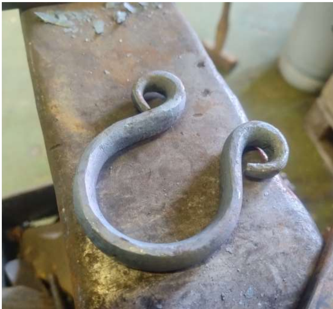
Ferdig hegde. Innvendig ca. 50 mm (2 toms).