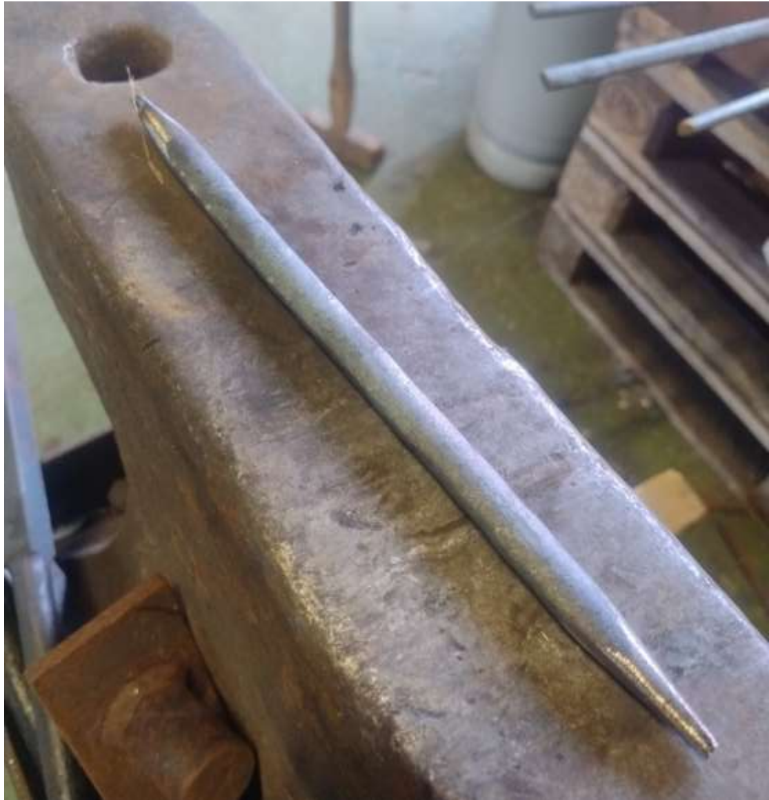
Emnet til 50 mm hegde. Kappet på 270 mm, og tynnet i endene.