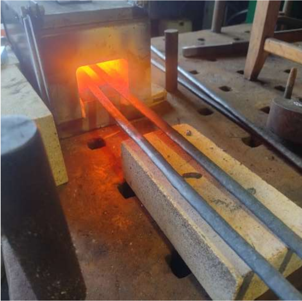
Emner varmes i lange lengder.